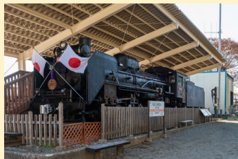
圧倒的な存在感の蒸気機関車