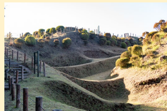
敵の動きを制限する仕組みの堀と畝