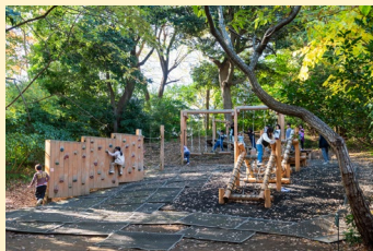
ミニアスレチックでおおはしゃぎ