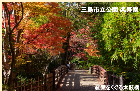
三島市立公園 楽寿園