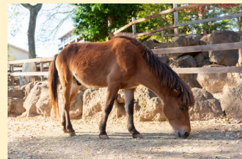
小柄でかわいらしい与那国馬