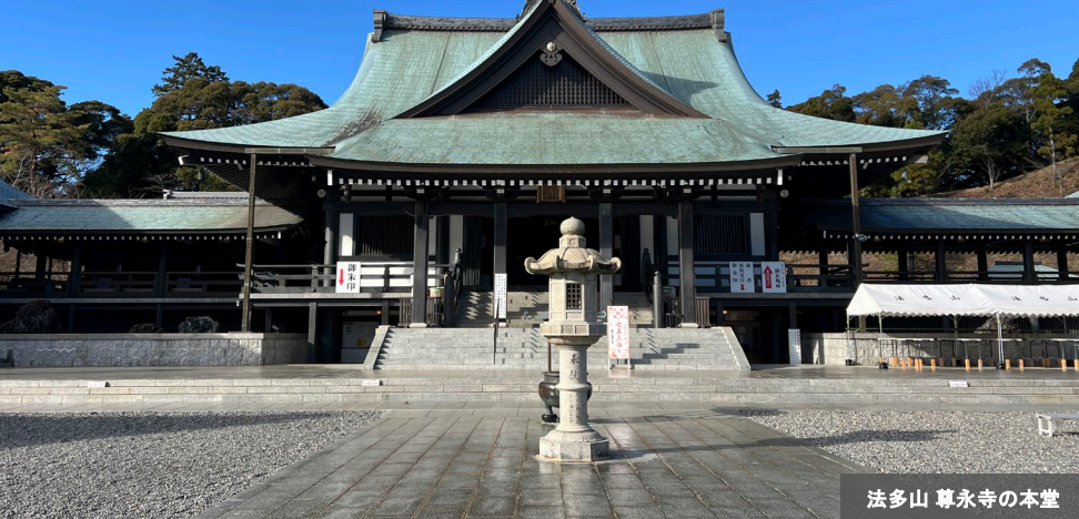
法多山 尊永寺の本堂