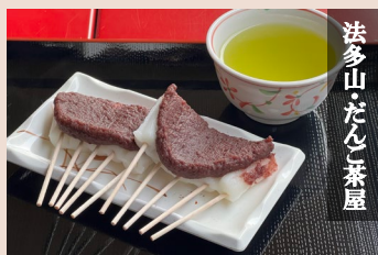
法多山・だんご茶屋