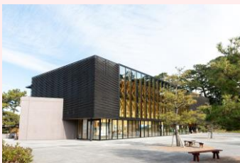
「みほしるべ」では冬期は足湯も楽しめます