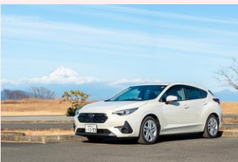
今回はインプレッサを相棒に