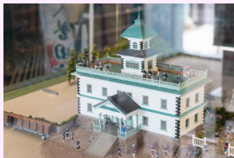
建設当時の学校を再現した可愛いジオラマ