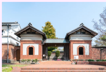
旧赤松家の立派な門構え