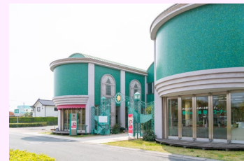
「香りの博物館」内藤ルネ展は6月21日まで