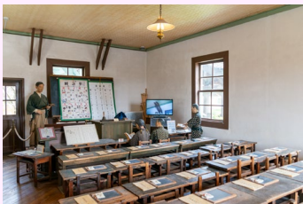
リアルなマネキンに思わずドキリ!