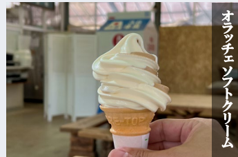
オラッチェソフトクリーム