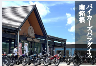
バイカーズパラダイス 南箱根