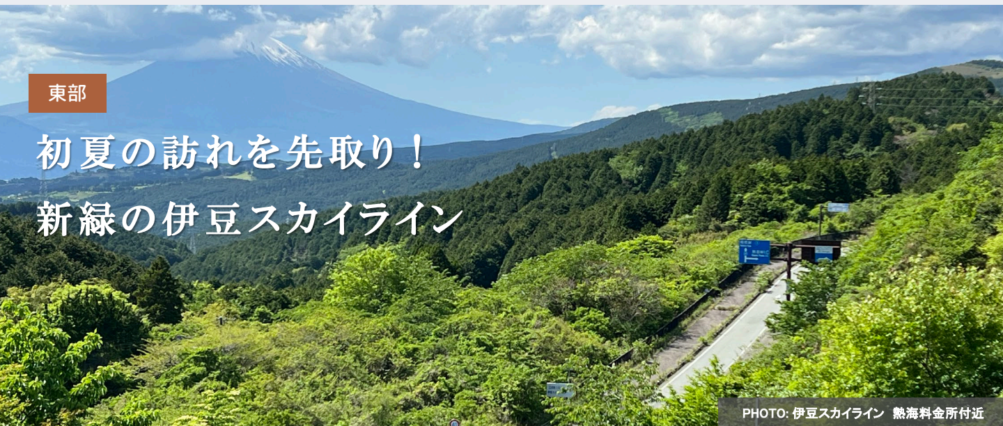
PHOTO: 伊豆スカイライン 熱海料金所付近

今月のすばるだよりは、初夏の香りに包まれた新緑の伊豆スカイライン周辺をご紹介します。熱海峠料金所からほどなく、まず立ち寄りたのが〈バイカーズパラダイス南箱根〉。富士山を望む高原に位置するバイク特化型ドライブインで、最新モデルのレンタルバイクや200席のカフェ、展示やショップなど設備が充実し、ツーリングの拠点として人気です。バイクを持っていなくても車で訪れ、1時間だけレンタルバイクを楽しむといった利用スタイルも可能で、気軽に走りを楽しめます。