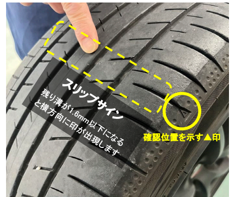
空気圧や溝の状態など、日常点検で特に重要な「 タイヤ 」

おクルマの日常点検の中でも特に重要なのが「 タイヤ 」です。車のパーツの中で唯一路面に接し、大きく重たい車体を支える重要な役割を担っています。空気圧やタイヤの状態は、たまにしか乗らない方も保管環境や経年劣化により安全性に欠ける場合がありますので、定期的に点検しましょう！ タイヤの残り溝が1.6mm以下になると現れるスリップサインをご存知ですか？これはタイヤがすり減ると出てくるもので、1か所でも確認できた場合、法律でタイヤの使用が禁止されています。また、スリップサインが出ていなくてもタイヤの側面は摩耗しやすく、バーストやブレーキ性能の低下など、思わぬ危険に繋がる可能性があります。同様に、空気圧の調整も定期的に行う必要があります。 点検時には必ずタイヤの状態を確認させていただいておりますが、気になる際にはお気軽に問合せ、ご相談下さい♪プロのメカニックがお客さまのタイヤの空気圧の調整や状態チェックを行い、タイヤの交換時期等をご提案させていただきます！