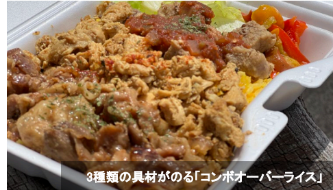
3種類の具材がのる「コンボオーバーライス」

〈ニューヨーク ベンディーズ〉は、本場ニューヨークのストリートフード「チキンオーバーライス」の専門店として、静岡で初の店舗です。清水エスパルスの本拠地、IAIスタジアム日本平で「アイスタグルメ」として親しまれ、Jリーグ屈指の人気を誇る定番の一皿。オーナーが毎年ニューヨークへ渡り研究を重ねるその味は、秘伝のスパイスが香るチキンと爽やかなソースが絶妙な本格派。魅力的なメニューの数々がさらに食欲をそそります。今回訪れた函南店のほか、キッチンカーで県内各地に出店しているので、公式インスタグラムで営業日や販売場所は要チェック！エスパルスファンにおなじみ、情熱の「屋台メシ」。その味を堪能してください。