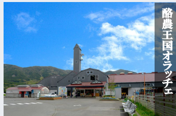
酪農王国 オラッチェ