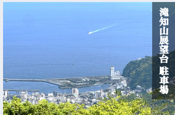
滝知山展望台 駐車場